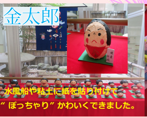
金太郎 水風船や粘土に紙を貼り付けて“ぽっちゃり”かわいくできました。