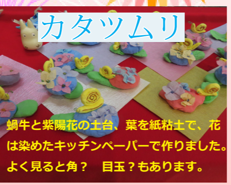
カタツムリ 蝸牛と紫陽花の土台、葉を紙粘土で、花は染めたキッチンペーパーで作りました。よく見ると角? 目玉? もあります。